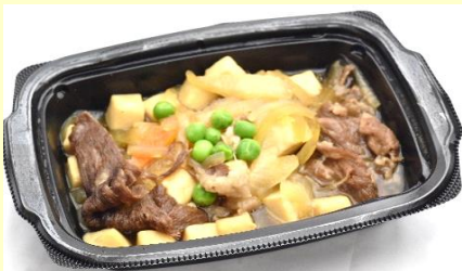
黒毛和牛の肉豆腐