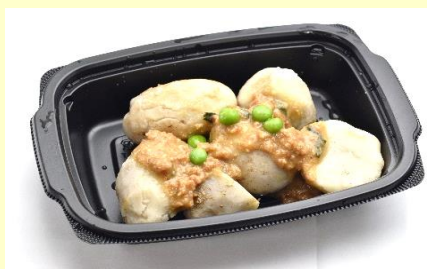
里芋の黒豚味噌田楽