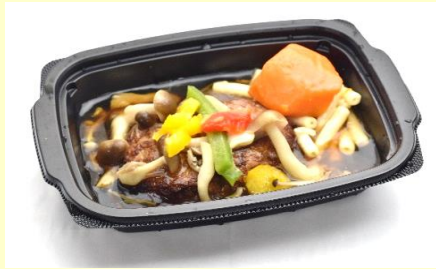
ハンバーグ茸ソース