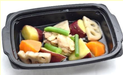
さつま芋ほくほく煮