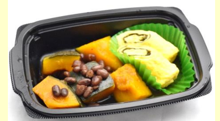
南瓜のいところ煮