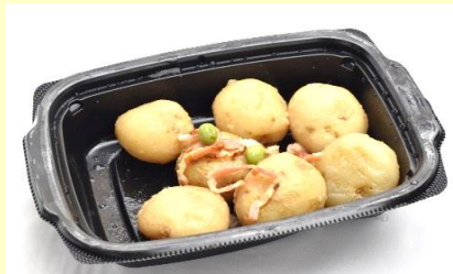
じゃが芋ベーコン煮